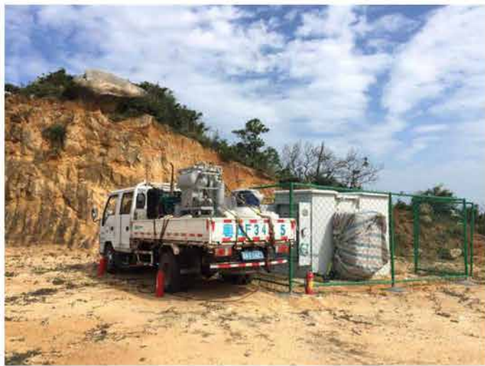
风电、光伏设备 检修现场